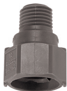
Корпус форсунки QPPA